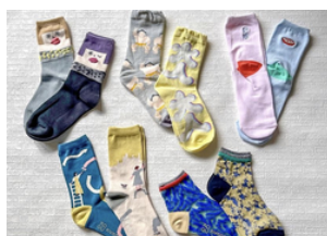
Naigai general store

地元の原材料と手作り製法にこだわった、こいうま生豆腐。大豆を使ったスイーツも販売しています。