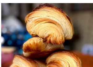
ちいさなしあわせパン☆