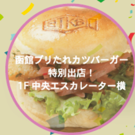
函館ブリたれカツバーガー 特別出店！ 1F中央エスカレーター横

マルシェブースご利用の お客様には、売店ポルックス、 函と館、3Fレストランポルックス で使える割引券をプレゼント！！