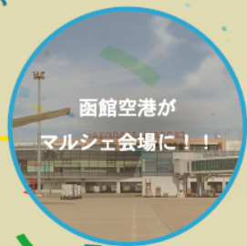
函館空港が マルシェ会場に！！