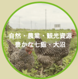
自然・農業・観光資源 豊かな七飯・大沼