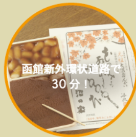
函館新外環状道路で 30分