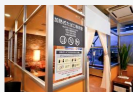
★ 国内線1F CAFE美鈴