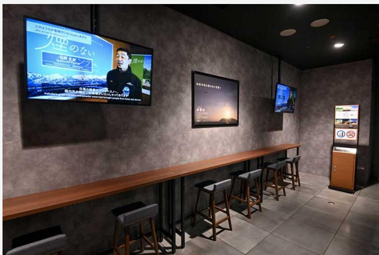
★ 国内線2F 搭乗者待合室内