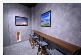
★ 国内線3F トイレ前