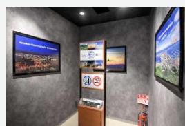
★ 国際線2F 出国待合室内