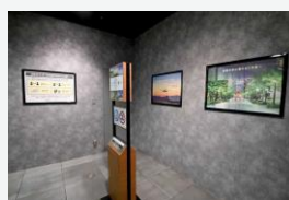
★ 国内線1F 到着口(手荷物受取)