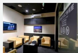
★ 国内線2F ビジネスラウンジ A Spring内